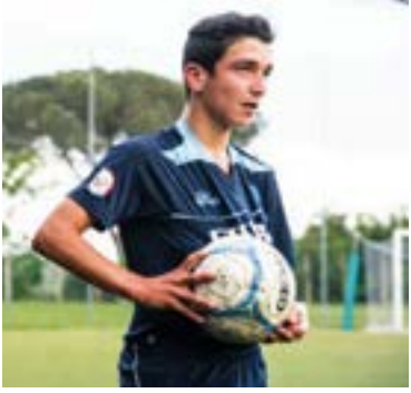
Esordienti Lodigiani @Rizzo

Aprilia, Trastevere, Romulea e Lodigiani strappano il pass da prime della classifica