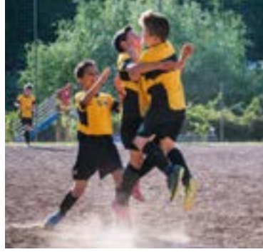
Esultanza Totti S.S.

Le squadre cercano gli ultimi punti necessari per centrare il passaggio del turno