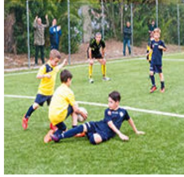
Petriana - Acquacetosa

Si giocano in settimana le rimanenti 8 gare del torneo: il divertimento è garantito